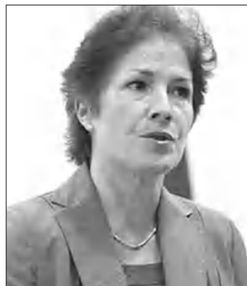
Հայաստանում ԱՄՆ նախկին դեստանման Մարի Յովանովիչ

Ահա դեստանմանի զեկույցի որոշ ուճագրավ հատվածներ՝ «Սիյուռնի համայնքների ներգրավման փորձը. Հայաստան» վերնագրով: