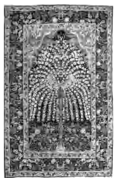
Պատկերագորգ, Հարավային Իրան, 19-րդ դար

Մուշեղ Չալոյանն ահա իրականացրել է բացառիկ երեւոյթ՝ Փարիզից բերված տարբեր երկրների շուրջ յոթանասուն գորգերի