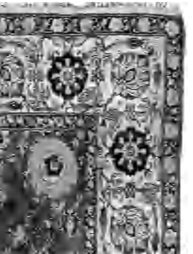
Գորգ «Գուն-Գափու» հայերեն գրություններով, 19-րդ դար

Նվիրատուներ Աղաբեկյանի ու Բաբրջյանի նման ինքս ուրախալի ծանոթացա նաեւ Չալոյանին: Նա ազգային դասկերասրահին նվիրեց հայտնի նկարիչ Պավել Կուզնեցովի «Արարատը» (1930), եւ փանդակագործ Հակոբ Գյուրջյանի