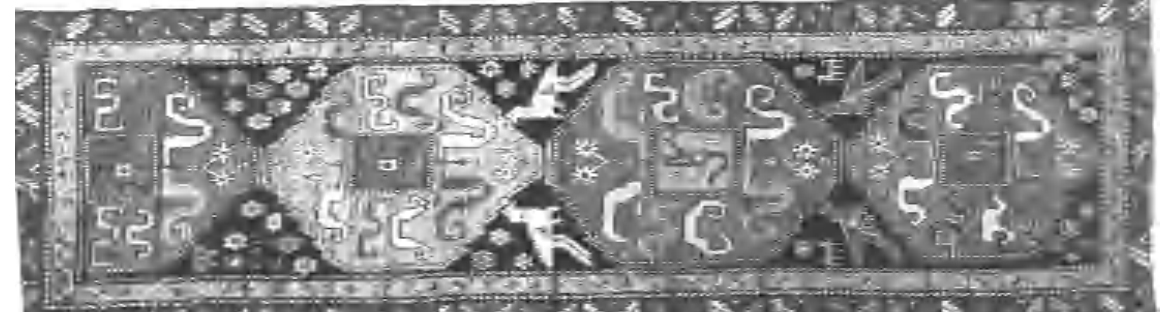
«Խնձորեսկ» բնույթի գորգ, Սյունիք, 19-րդ դար

ԱՇԽԱՏԱՆՔ ԽՈՍՏԱՐՅԱՆ Արվեստագետ, Ազգային դասկերասրահի տախկին տնօրէն