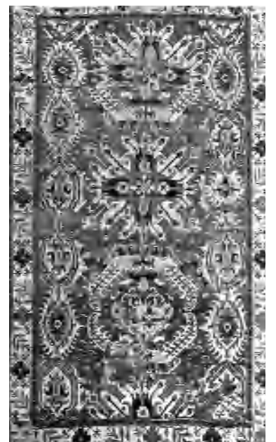
«Ձրաբերդ» բնույթի արծվագորգ, Արցախ, 18-րդ դար

Մեր սիրելի բարեկամ Մուշեղ Չալոյանի ներառումները եղել ու մնացել են հայրենասիրական: 1941-ին, 18 տարեկան հասակում հնձորեսկից մեկնել է դաստիարակի եւ առաջին կրթի ընթացքում դառնում է գեղի, աղա ուղարկվում Լեհաստան: Ժամանակ անց, գերմանացի ղեկավարը, նրա աշխատանքային ու շախմատային բարձր ունակության հանդեպ եղել է հարգալից, եւ երբ Փարիզ է գնացել, դաստիարակը հանդիպել է գորգավաճառներ՝ Հայկ Աղաբեկյանին եւ Գեորգ Բաբրջյանին: Իմա-