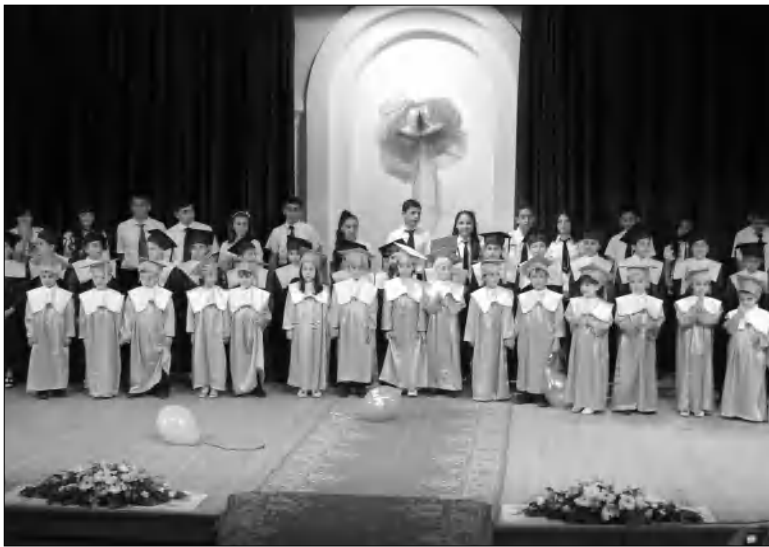
2012-ի ավարտական հանդեսը

- Պատմականորեն ավեսարանականները մեծ շեքստիստներ են անում կրթության վրա: Օրինակ՝ Աղջկանց առաջին դպրոցը հայ ժողովրդի մեջ եղել է ավեսարանական: Այն ժամանակ, երբ Արեւմտյան Հայաստանում ընդունված չէր, որ աղջիկները դպրոց գնային, դրան հայ ավեսարանականները դեմ էին՝ ասելով, որ ղեկավար է կիրք լինում նաև կանայք: