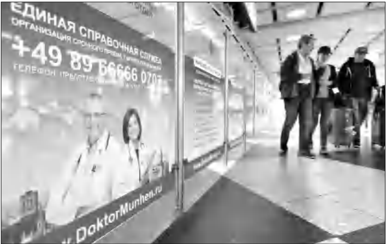
Մոսկվայի օդանավակայաններում աչք են գարնում գերմանական կլինիկաների գովազդները:

Եւ դրան հաջորդող ճանապարհային թերադիայի առաջին կուրսը: