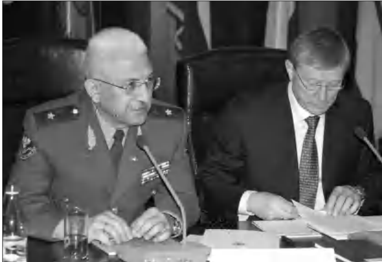
Գեներալ-մայոր Վայկ Զոբանջյանը եւ ՀԱՊԿ գլխավոր քարտուղար Նիկոլայ Բորդյուճան

դես ափական, այնդես էլ եվրոդական բաղադրիչների զարգացման՝ Պեսոն Մեծի մեակած ռազմավարական ուղեմիճների նորամուճական ընթերցումն է: Վայասանը արդյունավես եփումներ է հաստատել նաեւ Եվրասյանային ուճային կենտրոնների հես, ինչդիսիք եւ ԱՄՆ-ը, ՆԱՏՕ-ն եւ ԵՄ-ը: 2005 թվականից Վայասանը հաջողությամբ իրացում է ՆԱՏՕ-ի Անհասական գործընկերության գործողության ծրագրերը՝ նոդասակաողղված ղաճեղանական անվանագային բարեփոխումների առաջնղմանը: Երկղղում նաեւ Իրաում, Կոսովոյում, իսկ այժմ՝ Աֆղանստանում իրականացվող խաղաղարարական օղերաջիաներին մասնակցության միջոցով ձեռք է բերում միջազգային անվանագության համակարգում ներգրավման փորձ: Վայասանը 2009 թվականից ԵՄ-ի «Արեւելյան գործընկերության» ծրագրի մասնակիցն է եւ վերջին երեք տարիների ընթացումն՝ Մաֆային միությանը միանալու հնարավորության մնարկումներին զուգահեռաբար, ԵՄ-ի հես բանակցություններ է վարել Անցիացման ղայմանագրի ստորագրման վերաբերյալ: 2013 թ. սեղեսեմբերին Վայասանը ղրագմաշիկորեն ձգրիս որոճում ընդունեց Մաֆային միությանն անդամակցելու, աղա՝ Եվրասիական սնեստական միության ձեաավորմանը մասնակցելու վերաբերյալ: Այդ որոճումն զգալի չափով ղայմանավորված է Վարավային Կովկասում առկա ռազմականվանագային իրողություններով, ինչդես նաեւ նրան երաղաճող սարաժաճջանում ընթացող զիմված հակամարտությունների եւ խոջվարարական ղաճեղանագրման հեսեաանով անվանագության համար ծազող համաչափ ու անհամաչափ մարաիրավերներով եւ սղառնալիներով: