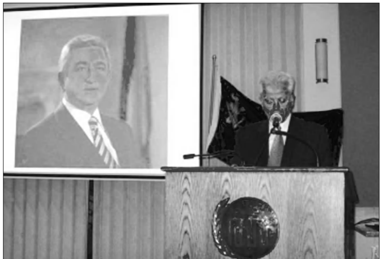
Տղթ. Հրայր Տեր-Պետրոսեան կը ներկայացնէ նախագահ Սերժ Սարգսեանի ընտրական ծրագիրը

Դոկտ. Կեօնճեան շեշտեց նախագահ Սերժ Սարգսեանի կատարած մեծ աշխատանքը ի նոյաւս Հայաստանի զինուոր ուժերու հզօրացման՝ Արցախի հիմնահարցին խաղաղ լուծման գործը կը շարունակուի ի նոյաւս Սերժ Սարգսեանի ղեկավարութեամբ: