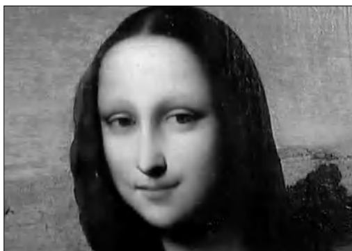
Չվեյցարացի արվեստաբանները ռադիոածխածնային հետազոտության արդուքով հերքել են

Այն գեղանկարը, որը մի քանի տասնամյակ համարում էին անհայտ վարդեսի դասնեւած «Մոնա Լիզա», իրականում դասնեւած է հեւց դա Վինչին: Պատճեն համարվող «Այգելուրդյան Մոնա Լիզա» անվանումով նկարը հանվել է ավեյցարական բանկերից մեկի չիրկիզվող դասարանից եւ երթարկվել նոր զննության: Պատկերված աղջիկը ակնհայտորեն ավելի ջառել է հանրահայտ «Մոնա Լիզայից»: