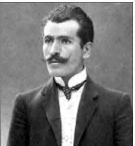
Զոթթահիայի կառավարիչ Ֆայիք Ալի (Օզանսոյ) բեյը

հիայի կառավարիչն էր: Նա եւս հրաժարվեց կասարել Սամբուլից եկած կարգադրությունները: Ընդհակառակը՝ հրամայեց լավ վերաբերվել այլ քաղաքներից Զոթթահիա աղտոսման հայերին: Նրան շուտով Սամբուլ կանչեցին՝ բացատրություններ տալու եւ հասկանալու, որ դասարարներ եւ եմքարկել կարգադրություններին: Իր բացակայությունից օգտվելով Զոթթահիայի ոսիկանադեճ Զեմալ բեյը սղանաց հայերին, ասելով, որ սեղանադրությունից ազատվելու համար նրանք թե՛ք է կրոնափոխ լինեն: Հայերը համաձայնեցին մահմեդական դառնալ: Երբ Ֆայիֆ Ալի բեյը վերադարձավ, զայրացավ եւ ոսիկանադեճին ազատեց դասընթաց: Աղա հայերին ասաց, որ ազատ են կրկին դավանափոխ լինելու: Բացի մեկ հոգուց՝ հայերը որոշեցին ֆրիսոնյա մնալ: