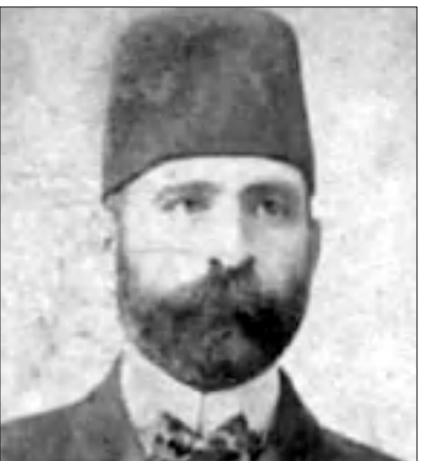
Լիսի քաղաքապետ Յուսեյին Նեսիմի բեյը