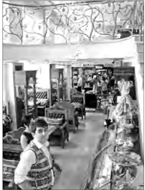
Խանութի մի մասը՝ համոտման անկյունով

ՏԻՉՈՅԱԿՈՒՄՆԵՐԻ ԾՐԱԳԻՐ «France-Arménie», septembre 2013 Ֆրանս. քաղաք. Պ. Բ.