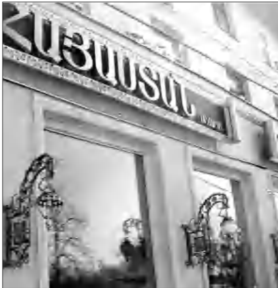
«Արմենիա» խանութի ցուցափեղկը

Եթե Մոսկվայում կա գասրոնոմիական շաքարավազի մի վայր, դա անվիճելիորեն «Արմենիա-Հայասան» բարձրակարգ նմանակերպի խանութն է: Քաղաքի բուն կենտրոնում գտնվող խանութի ղեկավարը սկսվում է խորհրդային ժամանակներից: Տնօրեն Սերգեյ Մնացորյանը սիրահոժար համաձայնեց այն մեզ ներկայացնել: