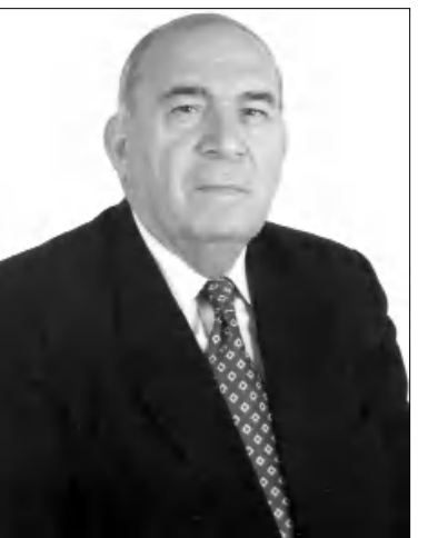
Պրոֆ. Վահան Բայրուրյան

1992թ. որոշումնական Վ. Բայրուրյանի կյանքում սկսվում է գործունեության մի նոր քաղաք: Նա հրավիրվում է դիվանագիտական աշխատանքի, մասնակցելով Իրանի Իսլամական Հանրապետությունում Հայաստանի Հանրապետության գործերի հավասարման (1992-1994թթ.), իսկ առաջ՝ արևելագետ եւ լիակատար դեսպան (1994-1998թթ.), անկախ Հայաստանի առաջին դեսպանը այդ երկրում: