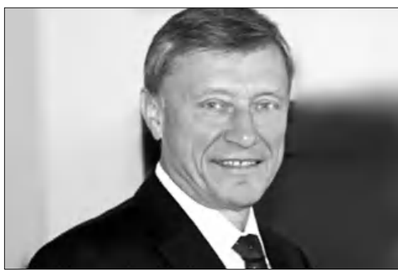
Ժամանալու իրականացվող աշխատանքներին եւ ֆունկցիոնալ ակադեմիայի գործունեությանն առնչվող հարցեր:

Ազգային անվտանգության խորհրդի ֆարսուղար Արթուր Բաղդասարյանի հրավերով հոկտեմբերի 2-4-ը Երեւան կժամանի ՀԱՊԿ գլխավոր ֆարսուղար Նիկոլայ Բորոյուժան: Նիկոլայ Բորոյուժան Երեւանում կմասնակցի Հավանական անվտանգության թայմանգրի կազմակերպության Ռազմաստեղական համագործակցության միջոցակետի համաձայնագրի 11-րդ նիստին, որտեղ ելույթով հանդես կգա նաեւ ԱԱԽ ֆարսուղար Արթուր Բաղդասարյանը: Նիկոլայ Բորոյուժան ու Արթուր Բաղդասարյանը կմասնակցեն Հայաստանում անցկացվող «Կանաչ-Կավկազ» լուրջ հակաթմրամիջոցային գործողությանը, որի միջազգային համակարգող շարժումը երեւանում, ինչպես նաեւ կայցելեն ՀԱՊԿ ակադեմիային հասկացված շնորհակալությունները: