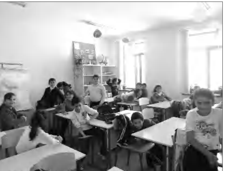
Աշակերտները դասից հետո

Գիտելիքի եւ ուսման նկատմամբ վերաբերմունքը Յայտասանում էլ փոխվել է, ցավով ոչ դեռ իրական: Պետական մանկավարժական համալսարանի կուրսորդի ֆակուլտետի դասախոս, բանասեր Գարեգին Գևորգյանը փաստում է, որ դեռ թուխ ուսանողների հոսի նվազման միտում կա: Հստակ լինում են դեռ իրենք, երբ բուհ ղիմողներն անգամ