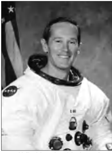
Ամերիկացի տիեզերագնաց Չարլզ Մոս Դյուկ կրտսեր

վել է Ադրբեջանի կառավարության կողմից՝ ոչ թե Պարզելու կամ գնահատելու, այլ Պարզադեպ թեմանմանով առանձնացնելու բոլոր նրանց, ովքեր Ադրբեջանում «սե ցուցակի» մեջ են եւ հայտարարված են «անցանկալի» անձ (persona non grata): Պատիվ ունեն ընդգրկված լինելու այդ ցուցակում եւ լրագրող չլինելով՝ ներկայացված լինելու որոշեց լրագրող: Ինձ համար իսկապես դասիվ է իմ անունը տեսնելու շահագրգիռ եւ միջազգային ճանաչման արժանացած անձնավորությունների կողմից: Նրանց թիվը այդ ցուցակում հասնում է