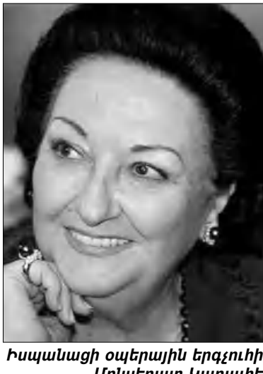
Իսպանացի օպերային երգչուհի Սոնտերատ Կաբալիե

335-ի, կազմելով «բախտավորների մի յուրահասուն ընկերակցություն»: Ադրբեջանական այդ «դասվո ցուցակում» ընդգրկված են տարբեր խավերի ու տարբեր մասնագիտությունների մարդիկ՝ լրագրողներ, ֆալսագետներ, գրողներ, արվեստագետներ, դասաւթաններ, գիտնականներ, բարերարներ, դիվանագետներ, օդերային երգիչներ եւ այլք, աշխարհի ամենատարբեր կողմերից՝ ճադոնիայից մինչեւ Արգենտինա եւ նույնիսկ հարեան Թուրքիայից, հաստատելով այն ճշմարտությունը, որ Ադրբեջանը թեմամիներ ունի անխախտ ամբողջ աշխարհում: