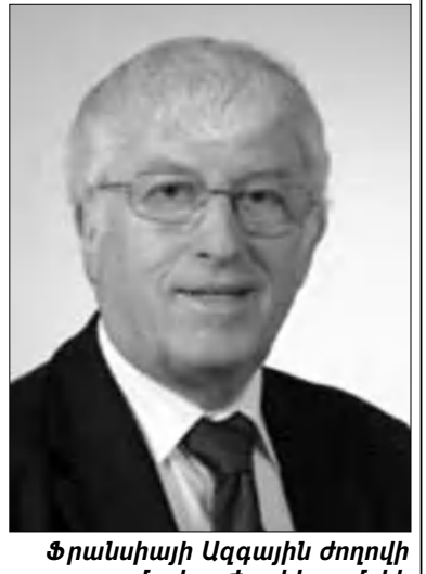
Ֆրանսիայի Ազգային ժողովի պատգամավոր ժորժ Կոլոմբիե

Իսկ նախագահ Իլհամ Ալիեւի անունը գուցե Սաֆարովից առաջ դրվի ցուցակում, քան որ նա էր, որ գնեց Սաֆարովի ազատությունը «նախա-դուրա-խախտարային դիվանագիտությամբ»: Ավելին, նա էր, որ միջազգային հանրությանը ցույց սվեց, որ հանցագործությունը գնահատվում եւ խախտվում է Ադրբեջանում: Եվ իհնա, երրորդ անգամ նախագահ ընտրվելու նախաեմին, ինչը ավելի շահ կետի մարդկանց ուսուցությունը ներքին խնդիրներից եւ անկարող կործանի նրանց ընդդիմադիր խմբավորում կազմելու, քան մի նոր ագրեսիայի սանձազերծում ընդդեմ Ղարաբաղի: