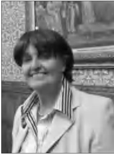
Բարնուտի Էրրույան Ընքս

վել է Ադրբեջանի կառավարության կողմից՝ ոչ թե Պարզելու կամ գնահատելու, այլ Պարզադեպ թեմանմանով առանձնացնելու բոլոր նրանց, ովքեր Ադրբեջանում «սե ցուցակի» մեջ են եւ հայտարարված են «անցանկալի» անձ (persona non grata): Պատիվ ունեն ընդգրկված լինելու այդ ցուցակում եւ լրագրող չլինելով՝ ներկայացված լինելու որոշեց լրագրող: Ինձ համար իսկապես դասիվ է իմ անունը տեսնելու շահագրգիռ եւ միջազգային ճանաչման արժանացած անձնավորությունների կողմից: Նրանց թիվը այդ ցուցակում հասնում է