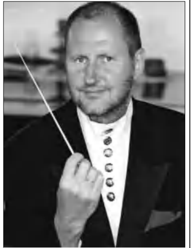
Ավստրիացի դիրիժոր Էռնեստ Գոնցոլի

վնաս են հասցրել Ադրբեջանին, քան որեւէ երգիչ, բարերար, դիվանագետ կամ ֆալսֆալսկան գործիչ: Ամենից հային քննադատական դատարանը ստանալով եւ հետագայում դատարանի արժանանալով՝ Ռամիլ Սաֆարովը աղագուցեց աշխարհին, որ ստանալով եւ հանցագործությունը ընդունված եւ խախտված նորմաներ են Ադրբեջանում: Նա դեմ է դասավորել սեղ գրավի այդ ցուցակում, քան որ իր հանցագործությամբ նա ավելի խաթարեց Ադրբեջանի հեղինակությունը, քան ցուցակում նշված 335 անձնավորությունները միասին կարող էին անել: