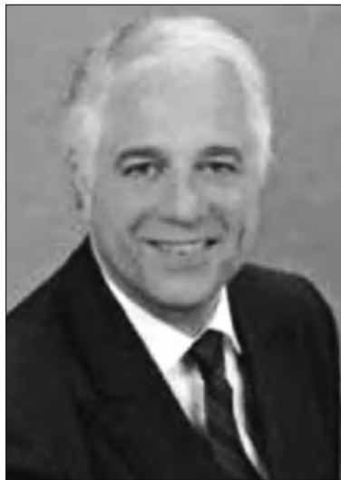
Բեռլինի ակադեմիայի նախագահ ղոկտ. Եկարտ Ստրաստենշուլտ

335-ի, կազմելով «բախտավորների մի յուրահասուն ընկերակցություն»: Ադրբեջանական այդ «դասվո ցուցակում» ընդգրկված են տարբեր խավերի ու տարբեր մասնագիտությունների մարդիկ՝ լրագրողներ, ֆալսագետներ, գրողներ, արվեստագետներ, դասաւթաններ, գիտնականներ, բարերարներ, դիվանագետներ, օդերային երգիչներ եւ այլք, աշխարհի ամենատարբեր կողմերից՝ ճադոնիայից մինչեւ Արգենտինա եւ նույնիսկ հարեան Թուրքիայից, հաստատելով այն ճշմարտությունը, որ Ադրբեջանը թեմամիներ ունի անխախտ ամբողջ աշխարհում: