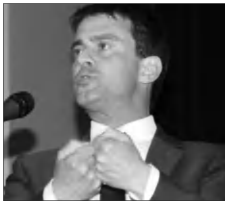
Պանագիներին, դորսուգալացիներին, արաբներին:

Ֆրանսիայի ներգործնախարար Մանյուել Վալսը կոչ է արել երկրից արտաքին օտարերկրյա գնչուներին: Նրա խոսքերով, գնչուները չեն կարող ինտեգրվել Ֆրանսիայում, ուսի նրանց մեծ մասին հարկավոր է «հեռու դարկել սահմանից այն կողմ»: Վալսի ձեռնարկած հակազնչուական արժույթն էլ դրա արձագանքներին անդրադառնում է մասնավորապես «Ֆիգարո» օրաթերթը: