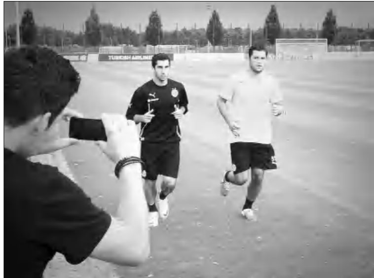
փոխարինող է համարվում Մարիո Գյոսցեին»:

Հիանալի արագության, կայծակնային մեկնարկի եւ գրոհը եզրափակելու գերազանց ունակության շնորհիվ 24-ամյա կիսապաշտպանին համեմատում են Ֆրենկ Լեմբարդի եւ Մարկել Յանսենի հետ: Պասսակալն էլ, որ «Շախյորի» կազմում հաջող լույսն էր բերում հետո Ֆենիսին ձեռք բերեց Դորսմունդի «Բորուսիան»: Հայ կիսապաշտպանն արժանի