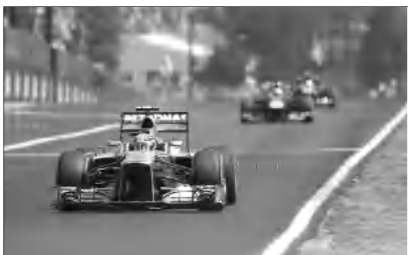
«Կոնսուրկոնների գավաթի» մրցաշարում 250 միավորով առաջիկ է ընթանում «Ռեդ Բուլը»: 2-րդ տեղում 183 միավորով «Մերսեդեսն» է: «Ֆերարին» 180 միավորով եզրափակում է լավագույն երջակը:

«Մերսեդեսի» ավտոմրցարկավոր Լուիս Տեմիլսոնը «Ֆորմուլա-1» դասի ավտոմրցարկի աշխարհի ընթացիկ առաջնությունում առաջին Գրան տրիս Եստեց: Նա հաղթող ճանաչվեց Գրանտրիսյան անցկացված աշխարհի առաջնության փուլում: Դա Տեմիլսոնի 4-րդ հաջողությունն է Գրանտրիսյան անցկացված Գրան տրիսի խաղարկություններում: 2-րդ տեղը գրավեց ֆինն ավտոմրցարկավոր Կիմի Ռայկոնենը, իսկ լավագույն երջակը եզրափակեց Սեբաստիան Ֆետելը: Գրանտրիսյան տոնած հաղթանակի շնորհիվ Տեմիլսոնն ընդհանուր հաշվարկով վասակեց 99 միավոր եւ տեղափոխվեց 4-րդ հորիզոնական: Առաջատար դերը դադարեց Սեբաստիան Ֆետելը, որն ունի 157 միավոր: Ֆեռնանդո Ալոնսոն 123 միավորով հետադուրս է ֆետելին: Լավագույն երջակը եզրափակում է Կիմի Ռայկոնենը՝ 116 միավոր: