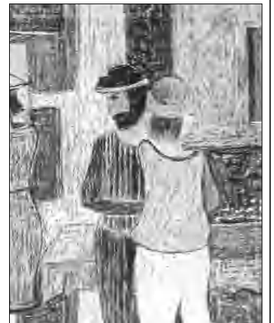
Բարություն ծառայաթող նրա կսավները միշտ կիսեցնեն իրենց ստեղծողի մասին: