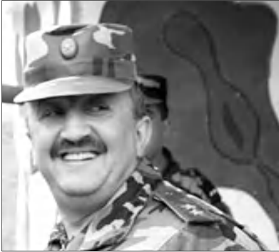
ՄՈՎՍԵՍ ԿՈՎՈՒՅՈՒՆՅԱՆ, Ստեփանակերտ, ԼՂՀ

«Այն, ինչ ծնվեց եւ, գրեթե» առաջին գիծ այցելած լրագրողներին հորդորում է ԼՂՀ դաշտայնության բանակի հրամանատար, դաշտայնության նախարար Մովսես Հակոբյանը՝ հավելելով, որ ԼՂՀ ՊՆ հիմնական խնդիրը եղել է մտնում է Դարաբաղի ժողովրդի անվանագրության աղախովումը, որն իրա-