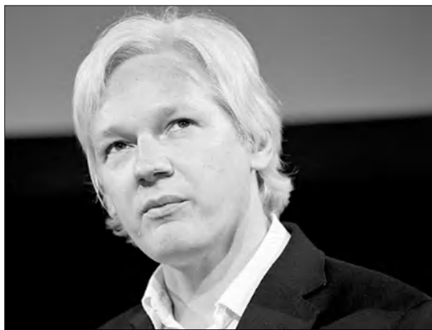
Վախենում են սեղանում WikiLeaks-ի լրագրողների հնարավոր ներկայությունից:

WikiLeaks կայքից հիմնադիր Ջուլիան Ասանժը հուլիսի 25-ին դաշնակցական հայտարարել է, որ սեղծվել է WikiLeaks կուսակցություն, որը սեղեկացրեին կմասնակցի Ավստրալիայի խորհրդարանական ընտրություններին: