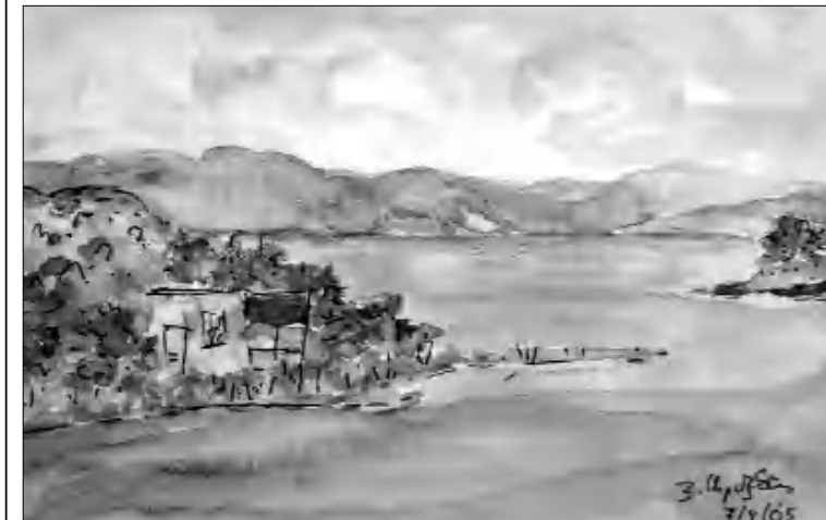
Յ. Արսենյան 7/1/65

զգալ բնության յուրաքանչյուր բարձուն, յուրաքանչյուր փոփոխություն, ծովի խռովի մեջ տեսնել ներքին հանդարտությունը, զգալ առավել լույսից կերպարի լաված ծառի սերը: Այդպիսին են նաեւ նրա գրական ստեղծագործությունները, արձակ բանաստեղծությունները՝ հանդարտ, խոհուն, մայրին մաքուր վիճակների խոսքային դրսեւորումներ: