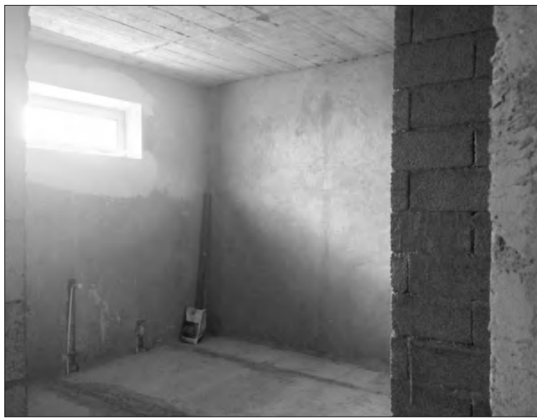
Քարոլին Բաղունյանի կիսակառույց սենյակներից մեկը

Քարոլին Բաղունյանն ամերիկահայ բժիշկ-ասանմարույժ է: Նա վաղուց երագել է հաստատվել Հայաստանում եւ ցանկացել, որ իր դուստրը մեծանա հայրենիքում: