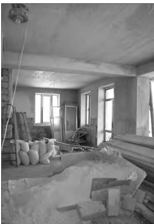
Կիսակառույցից մեկ այլ պատկեր

Նունուֆար Հովհաննիսյանը, դիմելով դատարան, դաժանել է հոգու իրեն սիկին Քարոլինից բռնազանձել 40 հազար դոլար ու սրան էլ գումարել համադաստատված տույժ-տուգանքի տուգանքները: