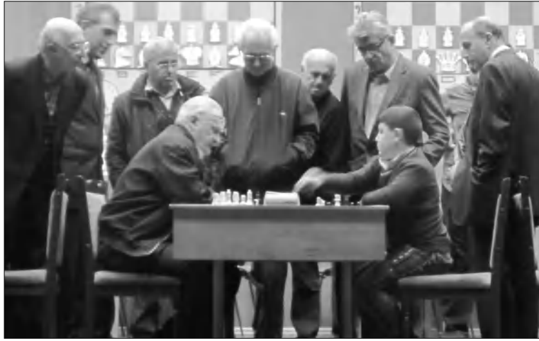
Խաղում են ամենասարեցը և ամենակրտսերը:

Երեանի ժամանակի կենտրոնական տունը այս օրերին մեղմանոցի է մնան: Չանազան մրցաշարեր, միջոցառումներ, բազմաթիվ երեխաներ... Չեն մոռացվում նաև վեներան շախմատիստները: Շախմատի սան ղեկավարությունը և Վեներան շախմատիստների խորհուրդը, որի նախագահն է Հայաստանի շախմատային ֆեդերացիայի նախագահության անդամ, Շախմատի թանգարանի հիմնադիր Ռաֆայել Չախնյանը, հաճախակի են կազմակերպում վեներանների մրցումներ, հանդիպումներ, մեծարումներ՝ արժանի հասուցելով այն մարդկանց, որոնցից, փաստորեն, սկիզբ է առել հայկական շախմատային մեղմանոցի հրաշալի մակարդակը: