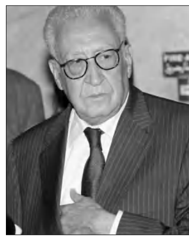
Նշվում է, որ Լախար Բրահիմին ընթացքում սա սիրիական տարածքից հարաբերական գնդակոծման առաջին դեմքն է:

Սիրիայի հարցերով ՄԱԿ-ի եւ Արաբական լիգայի հասուկ ներկայացուցիչ Լախար Բրահիմին մտադիր է Ռուսաստան եւ Չինաստան այցելել, այդ երկրների ղեկավարության հետ Սիրիայի իրադրության հարցը բնակարար համար: Այդ մասին Բրահիմին հայտարարել է ՄԱԿ-ի կենտրոնական գրասենյակում: