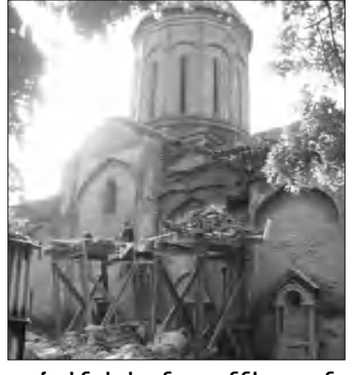
Սուրբ Նեան եկեղեցու վնասված վիճակը: Այսօր այն ավերվել է հրդեհի հետևանքով: Վրաստանի նախագահը խնայելով «հեռախոսային» ժողովի շինությունների վերանորոգման ու ընդհանրապես ժամանակակից սահմանների նորմալ վերահսկողության արտահոսման մասին: Աղետի հասցրած վնասը վրացի մասնագետները դեռ չեն գնահատել, բայց արդեն իսկ խոսվում է միլիոնավոր լարիների վնասի մասին՝ հաճախ առնելով, որ առնվազն 15 միլիոն լարի փոխվել է այլ կազմակերպությունները:

Այս առնչությամբ հայտարարություններ են արել ինչպես մայրաքաղաքի, այնպես էլ Վրաստանի նախագահը՝ խնայելով «հեռախոսային» ժողովի շինությունների վերանորոգման ու ընդհանրապես ժամանակակից սահմանների նորմալ վերահսկողության արտահոսման մասին: Աղետի հասցրած վնասը վրացի մասնագետները դեռ չեն գնահատել, բայց արդեն իսկ խոսվում է միլիոնավոր լարիների վնասի մասին՝ հաճախ առնելով, որ առնվազն 15 միլիոն լարի փոխվել է այլ կազմակերպությունները: