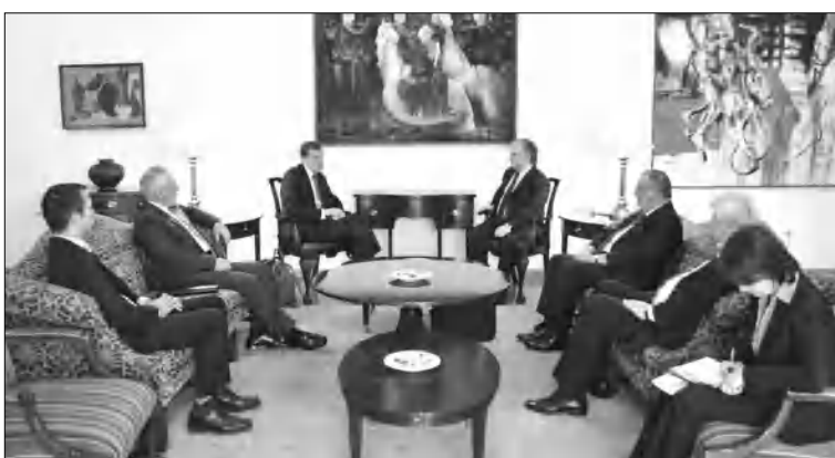
Սերժ Սարգսյանը (աջից) և Ադրբեջանի նախագահը (ձախակը) հանդիպում են Վաշինգտոնում: Սերժ Սարգսյանը խոսեց Սարածաբանության կարևորության մասին: Սերժ Սարգսյանը (աջից) և Ադրբեջանի նախագահը (ձախակը) հանդիպում են Վաշինգտոնում: Սերժ Սարգսյանը խոսեց Սարածաբանության կարևորության մասին: Սերժ Սարգսյանը (աջից) և Ադրբեջանի նախագահը (ձախակը) հանդիպում են Վաշինգտոնում: Սերժ Սարգսյանը խոսեց Սարածաբանության կարևորության մասին:

Եթե մեր սարածաբանում դարձրապա հսկանարությունը առնումով հարաբերական խաղաղության այս վիճակի դաժակությունը չհիսվեք առաջնայնություն, այլ համարվեք նաև հսկանարությունը լուծելու անհրաժեշտության շեշտադրմանը, զուցե հնարավոր լինեք խուսափել Ադրբեջանի սարածաբաններից ու զոհերից: Ավելին, եթե զոհեք եզակի անգամ Ադրբեջանի առաջ հարց բարձրացվեք իսկապես վերջ դնելու ռազմասենյա հռետարանությանն ու այդ անենը սնող սարածաբաններին, ապա կարելի կլինի ասել, թե ԵԱԿ Միսսիսի խուճը իր գլխավոր առաջնությունը իրագործում է բավարար մակարդակով: