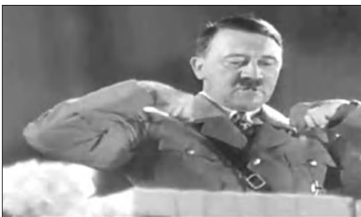
Varum benützt du Frauen Shampoo, wenn du kein Frau

Թուրքական Marka գովազդային գործակալու- թլւնը դադարեցրել է Bioman Եւրօպայի գովազ- դային տեսաողովակի ցուցարդումը: Աղովք Դիս- լերի «մասնակցութեան» սարքած տեսաողովա- կը Թուրքիայի հրետական համայնքի վորդովմունքն էր հարուցել, հարդորում է BBC-ն: Գովազդային գործակալութլւնը այդ տեսաող- լովակը նաեւ հանել է իր կայքէղէ: Marka-ի աե- խասակցեցը «Դուրիթ» թերթի թղթակցին հայ- տարարել են, թե իրենց գովազդի գաղափարը մարդիկ իր սխալ են հասկացել: «Եթե այս գո- վազդում Աղովք Դիսլերի փոխարեն ելույթ ունե- մար Մուսաֆա Քեմալ Աթաթուրքը, մարդիկ կն- տածին, թե մենք նրան ծաղրում ենք, իսկ երբ Դիս- լերն է, նրանք ասում են, թե մենք նրան գովազդում ենք», թերթին ասել է գործակալութեան սեփակա- նատեր Դուլուսու Դերիջին: Ավելի վաղ Turk Musevi Եւրօպայի հրետական կազմակերպութլւնը եւ երկրի գլխավոր ռաբբին դասադարսել էին գովազդը եւ դահանջել էին դադարեցնել դրա ցուցարդումը: Նրանք նեւ էին, որ առեւտրային նմասակներով Դիսլերի դասերի օգտագործումը անթույլատրելի է, եւ Marka-ից դա- հանջել էին հրաղարակել ներողութլւն խնդրել: