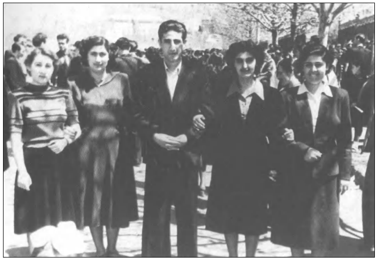
Ուսանողական սարիներ, մայիսից 1953 թ.

եր իր վարած ճկուն և հետևողական ֆաղափականությամբ, այն էլ միութենական ամենաշեշտ հսկող աչքերի ներքո: Ուսից հաճախ անհրաժեշտ էր գործել լուր, առանց բարձրաձայնելու, կամ՝ «վերելներին» համոզելու դեմիրճյանական դիվանագիտական ճկուն հնարներով՝ առերևույթ ղեկավարելով ղեկավարականության հավասարակշռությունը և հայ ժողովրդի անվտանգությունը: