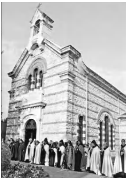
Սուրբ Փրկիչ եկեղեցին հիվանդանոցի տարածքում

Թեև Սուրբ Փրկիչ սնորհունորները ընդհանուր լեզու է գտնում Թուրքիայում կառավարող չափավոր իսլամիստների հետ, բայց կալվածների հարցում զերծ չի մնում իսլամիստներից: Այսպես, վարչապետ Էրդողանը 2004-ին Սուրբ Փրկիչ կառավարչության ժամանակ խոսեց Թուրքիայում խաղաղ գոյակցության արժանիքների մասին, դաժանացե՛ք հայերի լիարժեք ֆազիլեդարձության իրավունքը, բայց շատ քիչ է 1985-ին Պետրոսյան կողմից Սուրբ Փրկիչ կից հողատարածքի առգրավման հարցը: 43160 ֆառակուսի մետր մակերեսով այդ տեղամասը Չեթիմբուրունի մունիցիպալիտետին է փոխանցվել մարզադատարանի կառուցման ակնկալիով: Վարչապետի հրահանգին հակառակ՝ Սամբուլի դասարաններից մեկը վերջերս վճիռ կայացրեց այդ հողատարածքը իր օրինական սիրող վերադարձնելու մասին: