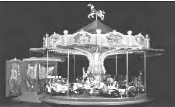
«Մանկական երկաթուղու» կարուսելները, իսկ «Հաղթանակ» զբոսայգում, ըստ բանախոսի, կարուսելների փորձաքննությունը դեռ ընթացքի մեջ է: «Սակայն որոշներին արդեն իսկ սրվել է թերությունները վերացնելու համեմատությամբ»: Ի. Պ.

Այսօր Հայաստանում գրանցված է 108 կարուսել, դրանցից 71-ը Երեւանում են, 6-ական՝ Վանաձորում ու Կարաբաղում, 19՝ Գյումրիում: Կարուսելները սարքավորված մեկ անգամ օրեմի դահլիճից համապատասխան փորձաքննություն անցնելուց, ու միայն դրական եզրակացություն ստանալուց հետո դրանք Երեւանում կարող են օգտագործվել: Երեկ այս մասին լրագրողներին տեղեկացրեց արակարգ իրավիճակների մախարարության սեփական անվանագրության ազգային կենտրոնի ղեկավար Անո Պետրոսյանը: Ընթացիկ սուսուզանները, ըստ նրա, դեմ է կասարի կարուսելը Երեւանում կազմակերպությունը: Սակայն այս սարի գրանցված 108 կարուսելներից փորձաքննություն են անցել դեռեւս 42-ը, 23 կարուսել ուսումնասիրության ընթացքի մեջ է, իսկ 43 կարուսելի փորձաքննության ժամկետը դեռ չի եկել: «Հեռուստային» ակումբում Անո Պետրոսյանը նշեց, որ այս սարվա փորձաքննության սլայդներն, անցյալ սարվա համեմատությամբ, ավելի գոհացուցիչ են: Մայրաքաղաքում անցնաբարվող փորձակում են «Լուսնադարի» ու