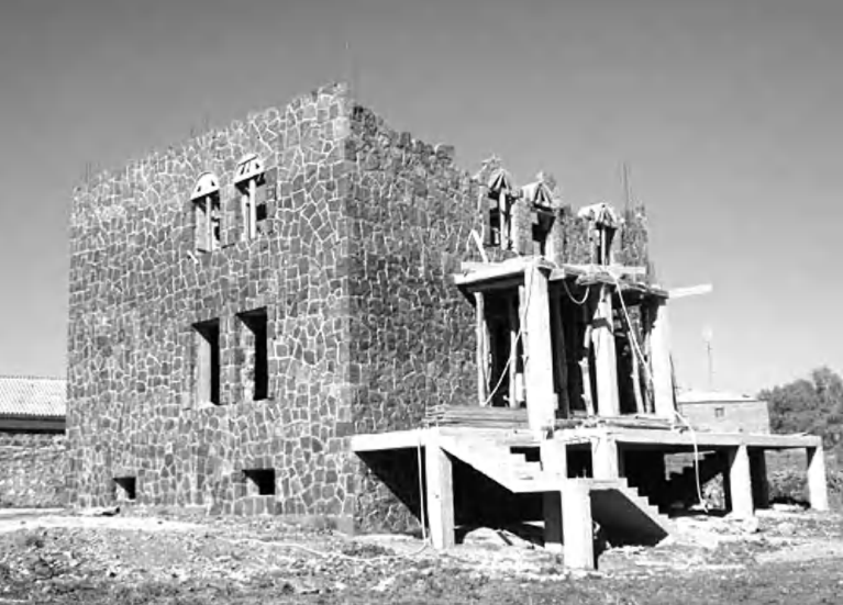
Ծովագարդի գերմանահայկական մշակույթի կենտրոնը

Մայիսի 21-ին, երբ Տայասանում ճեմակ էր ելուդայի օրը, գերմանական Նոյս ֆաղափի (Յուլիսային) Յուլիսային Վեսֆալիա երկրամաս) մշակույթի վարչությունը իր հովանու տակ արդեն 10-րդ անգամ անցկացվող «Նոյսի մշակույթային գիտեր» միջոցառման Երզնայում կենտրոնում ի թիվս ուրիշ երկրների թեմ էր սրամարդել Տայասանին: «Վեխարի մշակույթները. հայրենիքը՝ Նոյս» վերնագիրը համախմբել էր 100-ից ավելի մշակույթային միջոցառում՝ ընդգրկելով բազմազգ ֆաղափ բազմաձև մշակույթը: Տայասանին նվիրված երեկոն անցկացվում էր մշակույթի վարչության Կուլտուրալ կոնցերտի ճանաչված հասցեում, որ թարգմանաբար մշակույթի նկրտ է նշանակում: Այն թեւէ աղուսաւեն է, բայց գույնի եւ սրամարդություն կերտելու առումով հրաշալի «երկխոսում էր» մեր երկրի ֆարսեր գանձերը ներկայացնող լուսադասերների հետ, իսկ գերմանական երկնում առավոտից հայտնված սաֆ արեւն էլ իր դերը լավ մարմնավորելով՝ մարդկանց ուղեկցութային թափամբեցել էր նկրտ ու փորձում էր Տայասանի անունն առաջին անգամ լսողներին ամենակարելու մթնոլորտը փոխանցել: Մինչեւ ուր գիտեր թեման այդ ծանոթությունը մեր երկրին ու նրա մշակույթին թեւէ հոգանցիկ, բայց բազմաբնույթ հայացք էր ամփոփել՝ լուսանկար, երաժշտություն, դաս, նկարչություն, խոհանոց: