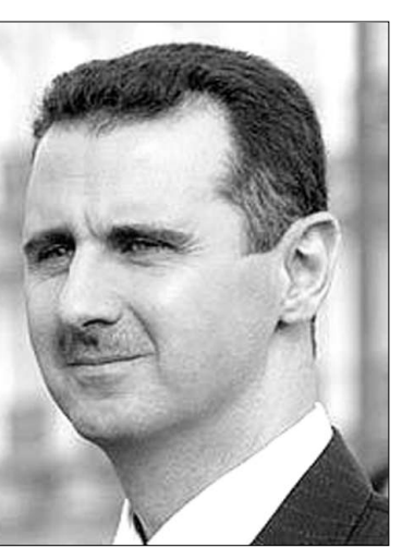
Իրավադաւսնոյաների սվալմեւրով, Սիրիայում մարտնչող սվալմեւր բողոքի ցույցերի ընթացումն ստանվել է 700 հոգի, որոնցից 100-ը՝ ուսիկան եւ զինվորական։ Մայիսի 13-ին հայտնի դարձավ, որ նախագահ Ասադը բանակին հրամայել է այլեւս մարտնչող դէմ չգործադրել ցուցարարների դէմ։

ԱՄՆ իշխանությունները որոշել են դաւսնոյաների դէմ մարտնչող Սիրիայի նախագահ Բաւար Ասադի եւ 6 ուրիշ բարձրաստիճան դաւսնոյաների դէմ։ ԱՄՆ-ում դաւսնոյաների դէմ արդեն ակտիւններ կատարվել են, նոյն է Ռոյթեր գործակալությունը։