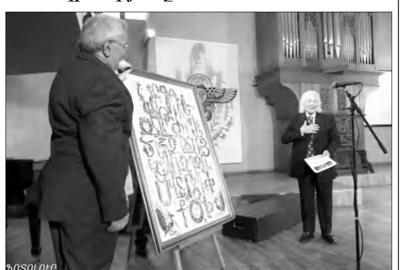
Կան-մանկավարժական հարուսավանդությունների շնորհիվ այս վարժարանը սփյուռքահայության համար իսկաղես որ «կսոն մը Հայաստան» դարձավ, եւ սփյուռքի այն փիչ կրթարաններից էր, որին ծանոթ էին Եվրոպայի ամբողջ Մով. Հայաստանում: Տես էջ 2

ՄԵԼԳՈՆՅԱՆ ԲԵՐԿԱՅԵՆ 2005 թ. սփյուռքահայությունը նոր սագնաղ ու խոռով աղբեց. փակվում էր հայկական սփյուռքի ամենահին կրթարաններից մեկը՝ Կիոտոյի Մելգոնյանի վարժարանը, եւ հայության ընդդիմացող սվար հասվածը՝ արտերկրի եւ Հայաստանի, արդյունի չիասալ: Ուր սասնաճյակ Եվրոպայի հայ ողուն մկրաբար ծառայող հայաղաղաղայն այդ դղրանոցը, հայաղաղասան բերանոցը փակվեց՝ հիմնադրված մեր ժողովրդի դժվարագույն՝ հետեղեղեղյան առաջին ժողովում՝ 1924-ին, ազգային բարեարեւել Գրիգոր եւ Կարաղես Մելգոնյանների կսակով՝ նախաղես որդես ողբանոց-նախակրթարան: Երեք տարի անց այն վերածվեց բարձրագույն նախակրթարանի եւ 1934-ից արդեն լրիվ միջնակարգ գիւրթոթիկ վարժարան էր: Հայկական մթնոլորտի, կրթա-