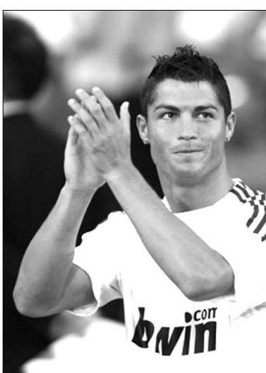
Նսեն, որ Իսպանիայի առաջնություններում մեկ մրցաշրջանի արժանավետության ռեկորդը մասկանում է Մարիոն «Ռեալի» լեգենդար ֆուտբոլիստներից մեկին՝ Ռոնալդուն: Ուզո Սանչեսին, որը խփել է 38 գոլով: Այս առաջնությամբ Ռոնալդուն հեռեցյալն է ասել. «Դա ճիշտ է, որ լայնաբեր էս խաղի ռեկորդը գերազանցելու համար: Խաղը նկատմամբ իրոք փորձում են այդ հարցում իմ շաքակցել: Սակայն ռեկորդ սահմանելն իմ գլխավոր նպատակը չէ»:

Իսպանիայի առաջնության 36-րդ տուրում, «Խեսպեթի» հեռ խաղում դառնալով հեթ սրիկի հեղինակ, Մարիոն «Ռեալի» կիսապատասխան Զիչեսիանու Ռոնալդուն գոլերի թիվը հասցրեց 36-ի և վստահորեն գլխավորեց լավագույն ռմբարկուների ցուցակը: 31 գոլով 2-րդ տեղում «Բարսելոնի» հարձակվող Լիոնել Մեսսին է, որը երեկ ուժեղության թիմի կազմում ղեկավարեց 36-րդ տուրի հանդիպումը: