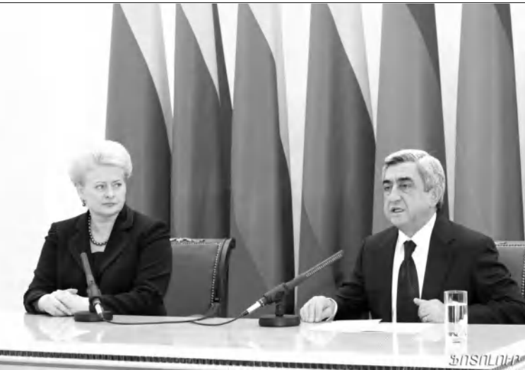
Տ. ԱՅՅՈՒ ԵԱՀԿ-ում նախագահությունը ստանձնած Լիսվայի նախագահ Դալյա Գրիբաուսկայեն վերջին օրերին Բաքու և Թբիլիսի այցելելուց հետո երեկ ժամանեց Երևան: Հայաստանի նախագահի նստավայրում երկկողմ հանդիպումից

հետ երկու նախագահները հանդես եկան ամփոփիչ հայտարարություններով: «Մեզ համար շատ կարևոր է Հայաստանը՝ որտեղ կայունացնող գործուն», այսպես սկսեց իր խոսքը Լիսվայի նախագահը: Անդրադառնալով հարավկովկասյան հակամարտություններին՝ Տիկին Գրիբաուսկայեն ընդգծեց. «ԵԱՀԿ-ի հիմնական նպատակն է, որ յուրաֆանչյուր հակամարտություն լուծվի միայն խաղաղ ճանապարհով: Որևէ միջազգային կառույց երբևիցե չի ստատի ռազմական լուծումը: Հենց սա է եղել իմ հստակ ուղեցույցը վերջին օրերին այցելած երեկ երկրներին»: Տիկին Գրիբաուսկայեն կարեւորեց նաև հանգամանքը, որ «չնայած Հայաստանի դատական անցյալին, աղբյուրը ցավերին, այս ժողովուրդը դատարար է խնդիրները լուծել խաղաղ ճանապարհով»: