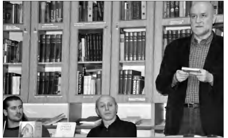
Սկարում՝ Ֆայասանուն Սերբիայի Հանրապետության Պասվո իրադասու Բարկեն Սիմոնյանը որդի Ալինա Փախլեանյանին է հանձնում արժեքները Գլխավոր Գլխավոր Գլխավոր:

Երեսուցի Կոմիտասի անվան կոնսերվատորիայի հայ երաժշտական ֆոլկլորագիտության ամբիոնը լավ ցուցանիսներ է ցուցաբերում: Նվիրված Ֆայասանուն Սերբիայի Հանրապետության Պասվո իրադասու, գրող, թարգմանիչ, հրատարակազոր, մշակութային գործիչ Բարկեն Սիմոնյանին է: