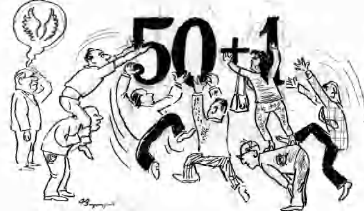
Հանգուցյալ մեր երգիծակարիչ Գեորգի Յարայանի անսիպ գործերից:

ՄԱՐՏԻՐՈՍ ԽԱՉԱՏՐՅԱՆ Երջանառվող խոսակցությունների համաձայն՝ մեղ Երջանակում մնանրկումների ժամանակ նախնական համաձայնություններ են ձեռք բերվել առաջիկա խորհրդարանի փաթեթի վերաբերյալ: Իհարկե, դեռ այդ փաթեթը որոշակի փոփոխություններ կկրի՝ հետագա ազդեցություններ կամ սարբեր բանակցություններ հետեանում: Սակայն այս դասի վերեւերի դասկերացումներն ադադա խորհրդարանի վերաբերյալ այս են ես հետաքրքրական նրանով, որ արտահոսը սեղի է ունեցել ՀԱԿ-ի իշխանություն մեղանսի ֆոնին, ինչն էլ կամ որոշ կուսակցություններին խոսք հասկացնելու համար է, որ ձեռ փաթեթն առաջիկայում խորհրդարանում հայտնվելու երազանից, կամ դարգադես ոմանց իրենց սեղը ցույց սալու գործի: Ծիւսն ասած՝ ամեն անգամ այսդիսի սեղեկությունների մասին գրելիս մեղի զգացում ենք ունեւում հասարակ ընտրողի առջեւ, որին այս կարգի լուրեն առհասարակ կարող են կազմալուծել՝ գրկելով հեռանկարից, բայց հայասանյան իրականությունը մեր գրել-չգրելով չի փոխվում: Մյուս կողմից էլ՝ ընտրող