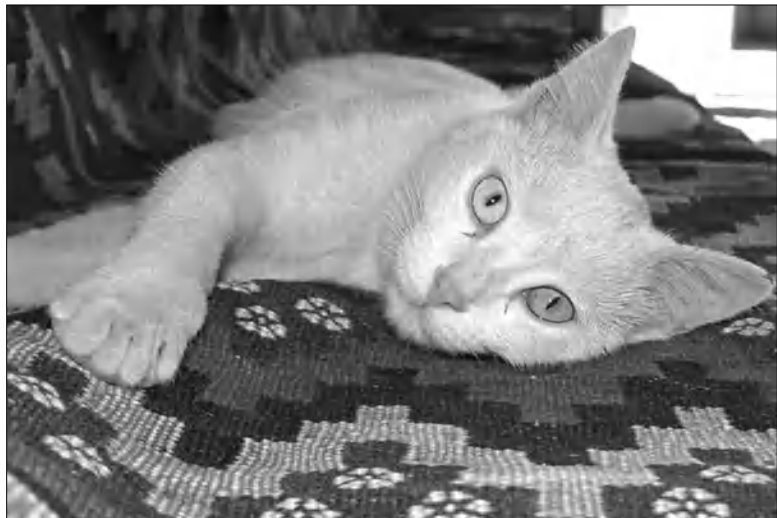
Յուրաքանչյուր վանեցի սատելու է. «Սա մեր կատու ի»...

Անկարայից, ՏԶՖ փոխնախագահ Վալիթ Խիթաբայան