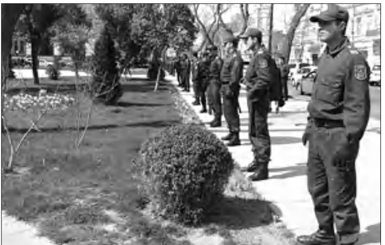
«Սահիլ» գրասրահում հարող փողոցները ոստիկանության կողմից շրջափակված են:

Հասանովի «մտքի թռիչքն ուղղակի հրաբուխ է գործում», երբ նա անցնում է բուն ասելիքին: Նա գտնում է, որ ընդդիմությունն իր բողոքի ակցիան դեմ է անցկացնել այնտեղ, որտեղ «կարողանա հավաքել համակիրներ»: Հակառակ դեպքում, ըստ կառավարող կուսակցության գործադիր ֆարսուղարի, ստացվում է այնպիսի, որ «գալով մարդաբնակ վայրեր, ընդդիմությունը կարող է սղավորություն ստեղծել, թե հանգստացողները