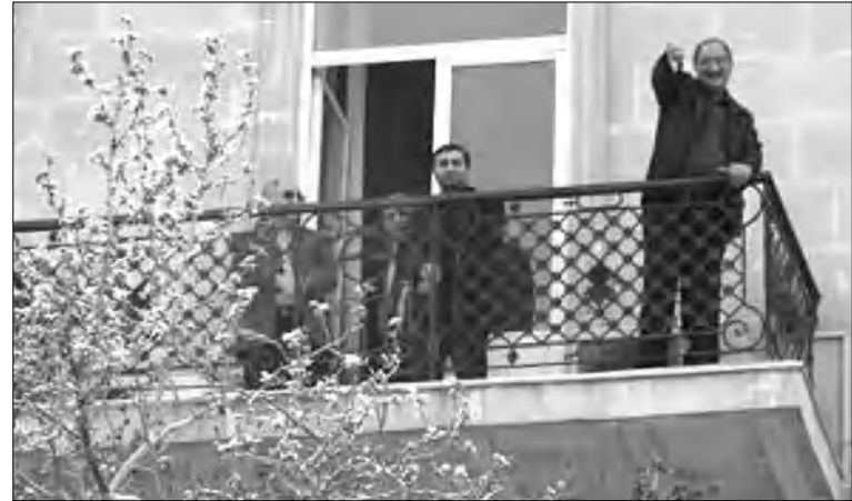
Ֆազիլ Աղամալին հորդորում է «սղանել ցուցարարներին»:

Հիշյալ տեղեկատվության իսկությունը «Պոլիզոն» վերլուծական կայքը հիմնավորում է այն իրողությամբ, որ եվրոպական շուրջ երկու ժամանակ երկրների դեսպաններ «Մուսավաթ» կուսակցության գրասենյակում «փակ հանդիպում են անցկացրել ընդ-