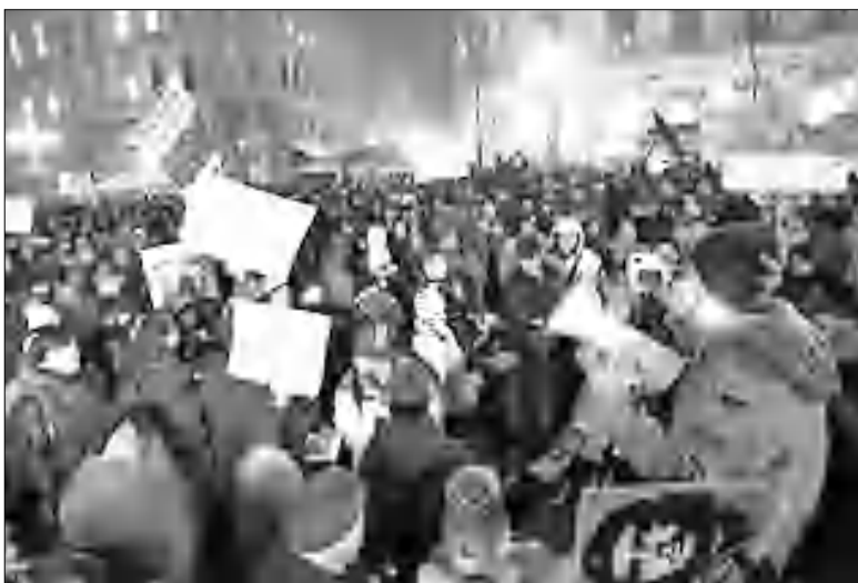
մեծ մասը երիտասարդներ են, որոնք բողոքում են կառավարության վրա:

Հանրահավաքներ են անցկացվել երկրի Ռիեկա, Սոլիս, Զյակով ֆաղաներում: France24 հեռուստաալիքը հաղորդում է, որ ցուցարարների