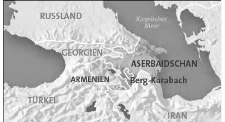
Քարտեզում ԱՂ-ն պատկերված է Ադրբեջանից տարբեր՝ Զայաստանի գույնով:

Բայց ի՞նչ դիրքում կորեզրի Արեւոսեւր մի երկրի հանդեմ, որը Ռուսաստանի եւ Իրանի միջեւ գազ է նավթ փոխադրող կարեւորագույն ուղի է, որի մասնակցությունը «Նաբուկո» ծրագրին անխուսափելի է, որը սարիներ է կառուցում ՆԱՏՕ-ի Գործընկերություն հանուն խաղաղության ծրագրին եւ ծառայում է որդեմիջոցակալ կայարան Աֆղանստան ուղեւորող փոխադրամիջոցների համար, որի առաջնությունը իր ռազմավարական առավելությունն է, որն այնուհետ է գործադրում, որ բոլոր մեծ ուժերին իր հանդեմ բարեհաճ է դառնում: