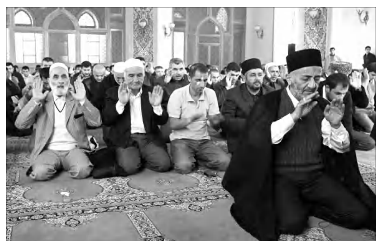
Ադրբեջանում շատերն իսլամի չափավոր կողմակիցներ են: Կառավարությունը, սակայն, կարծիք միջոցներ է ձեռնարկում իսլամական ընդդիմադիրների հանդեպ:

Այսօրվա եզակի հաջողությունները Ադրբեջանի ակտիվիստներից օտարները հոռետեսությունը փչ են փոխում: Գործնականում յուրաքանչյուրն է հասկանում, թե նավթային օժանդակումներից ստացված մուսուլման արդեւաբան են զազաթնակեցին: Բլոգեր Ադնան Զաֆրադեն երկուդում է, թե կառավարությունը հետ ավելի կարծ միջոցառումներով փորձ կանի իր իշխանությունը դատաւար: Ընդդիմությունն այնքան լիովին կկործանվի: Բայց Եգիպտոսի եւ Թունիսի օրինակը ցույց է տալիս, որ հասարակության մեջ խոսակցի բացակայությունը հենց կառավարության համար կարող է վստագավոր լինել: Այնտեղ (խոսքը Թունիսի մասին է - ԱՄ. Գ.) կարճ ժամանակամիջոցում զարգանում է ընդդիմադիր կառուցվածքից, առաջնորդի գուրկ ժողովրդական մի շարժում: Երբ Թունիսի նախկին նախագահը զայրացած ամբոխին ուզում էր զիջումներով դիմել, բացակայում էր բանակցող անձը՝ գործակիցը: Նա չէր կարողանում ժողովրդի դատաւարներին արագ արձագանքել, քանի որ բնակչության հետ հաղորդակցությունից գուրկ էր: Վերջ ի վերջ զանգվածների շարժման ընթացքը սփոթեց նախկին նախագահին գլխադրույթ փախելու երկիրը: