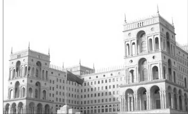
Միայն կառավարության շենքը չէ, որ Ադրբեջանը ժառանգել է ԽՍՀՄ-ից: Դադարից հետո իշխանությունը վերստանձնեց Զեյնալ Ալիևը, ինչն այժմ որդու ձեռքում է:

«Կանցլեր Մերկելը, թունիսյան եւ եգիպտոսյան իրադարձությունները նկատի առնելով, խոստացել է մարդու իրավունքների հարցում այլեւս որեւէ փոխզիջում չառնել: Ինչպես են երիտասարդ բազմաթիվ ակտիվիստներ այսօրվա խոստումը լուրջ առաջարկում և արդյունքում այդ հույսը իրականում հաճախ ի դեմ է ելնում, ցույց է տալիս Ադրբեջանի օրինակը», փետրվարի 13-ին այսօրվա լրատվական ծրագրում ասել էր ԱՄՆ-ի արտգործնախարար Կոնդոլիզա Րիս Մակոմբսը: