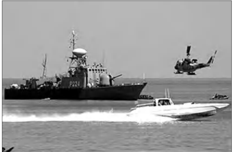
1979-ի Իսլամական հեղափոխությունից փոխադրված անգամն է, որ Իրանը ռազմանավեր է ուղարկում Միջերկրական ծով, նշում է «Չափեր» թերթը: Իսրայելի ծովային ուժերը Իրանի ռազմանավերը բնութագրում է իբրև «սադրան»: Արտոն-նախարար Ավիգոր Լիբերմանը միջազգային ընկերակցությանը

Իսրայելի ծովուժը հետևում է Սուեզի ջրանցքով դեղին Սիրիա արժվող իրանական երկու ռազմանավերի ընթացքին: Լույս հիմնադրամիջոցները նախատեսում են ջրանցքում իրանական ռազմանավերի ընթացքին: Լույս հիմնադրամիջոցները նախատեսում են ջրանցքում իրանական ռազմանավերի ընթացքին: Լույս հիմնադրամիջոցները նախատեսում են ջրանցքում իրանական ռազմանավերի ընթացքին: