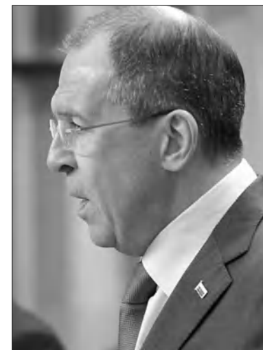
ընդգծել է, որ թագավորությունը դաշնակցության է բողոքի խաղաղ ձեռնարկումների իրավունքը: Նա իր ելույթում ասել է, որ Լոնդոնը բողոք դեմոստրացիաներին (առաջին հերթին՝ Իրանին) կոչ է անում հարգել մարդկանց այդ իրավունքը:

Մեծ Բրիտանիայի արտգործնախարար Ուիլյամ Հեյզը, ընդհակառակը,