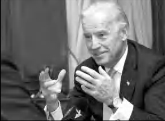
ՊԿԿ-ի առնչությամբ նա խոսել է ֆրական այս կազմակերպության ահաբեկչության դեմ Թուրքիայի դաշնակցության վարչակարգի սահմանած շարժարարությունների մասին։ Այնուհետև Բայդենը արձանագրություն Իրանի ազդեցության հետզհետե թուլացման կարծիք է հայտնել, ասել է, որ փոխարենը այս երկիրը պետի ու պետի է մեկուսացնում, ընդգծելով Իրանի դեմ գործադրվող ճնշումները Կարունակելու անհրաժեշտությունը։ ԱՄՆ փոխնախագահը Սիրիայի առնչությամբ նշել է, որ այստեղ խնդիրը սեփական ժողովրդին ստանող վարչակարգն է, իբրև Թուրքիայից նախագահ Բաբար Ասադի հեռացման հարցում ձեռավորվում է միջազգային համերաշխությունը և այս համերաշխությանը առաջնորդում է Թուրքիան։ Stu tğ 4

ՎԱՏԻՍ ԱՅՏՆԵՍՅԱՆ Անցյալ Եվրոպա թուրքիայի այցելության ընթացքում ԱՄՆ փոխնախագահ Ջորջ Բայդենը Մինչ այդ նա եղել էր Բաղդադում, ապա Յուսուբիայի իրաքի «Զուրիխում» Երթուղիի մայրամասում էր։ Փոխնախագահ Բայդենը Անկարայում հանդիպեց Թուրքիայի Ազգային մեծ ժողովի՝ Մեջլիսի նախագահ Ջեմիլ Չիլչեֆի, այնուհետև հանդիպեց Թուրքիայի Ազգային Մեջլիսի, իսկ Եվրոպա օրը Սամսոնյան վարչապետ Ռեջեփ Թայիփ Էրդողանի հետ։ Ի դեպ, վերահասուցումից հետո Թուրքիայի վարչապետը ադախնվում էր առանձնապես։ Այդուհանդերձ, շուրջ 45 րոպե նախատեսված Էրդողան-Բայդեն հանդիպումը տևեց 2 ժամ։ Ինչպես Չիլչեֆի էլ Պոլսի հետ հանդիպումներում, այնպես էլ Էրդողանին այցելելիս, Ջո Բայդենը թուրքական կողմի հետ մտնել էր Իրաֆին, ՊԿԿ-ի դեմ դաշնակցություն, Սիրիային, Իրանին, թուրք-խրայելական լարվածությանը, Կիրոսին, Բալկաններին և Հայաստան-Թուրքիա հարաբերություններին առնչվող խնդիրներ։ Էրդողան-Բայդեն հանդիպմանը կողմերը գլխավորապես կենտրոնացել են Իրաֆի վրա։ Ըստ ամերիկյան մի բարձրաստիճանի դիվանագիտության, ԱՄՆ փոխնախագահը, արձանագրելով Իրաֆում Իրանի իսլամական Հանրապետության ազդեցության հարցը, ինչպես ղեկավարելու 4-ին վկայել է «Ջամանը», ասել է, որ այդ ազդեցությունը առհասարակ գերազանցանալով է, իրազդերն էլ կարող հավանությունը սալ արտաբերում են միջանկյալ։