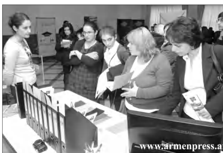
Կա այս նախաձեռնությունը, որի այն կարող է ընդօրինակելի դառնալ հանրագումարի դեպքում: Մ. Խ.

Երեկ Երեւանում, «Կոնգրես» հյուրանոցում, ԱՄՆ շրջանավարտների առցիացիայի նախաձեռնությամբ, բացվել է աշխատանքային տնավաճառ, որի նդասակն է աջակցել ԱՄՆ փոխանակման ծրագրերով ուսանած հայ շրջանավարտներին գործունե գտնելու հարցում: Տնավաճառում ելույթ է ունեցել Հայաստանում ԱՄՆ դեստան Ջոն Դեֆերը՝ ողջունելով մասնակից ընկերություններին, որոնց թվում են «ԱՇխարհի կաթը», «Ամերիա» բանկը, Կենտրոնական բանկը, «Կոնգրես» հյուրանոցը, «Նաիրի» ադահովագրական ընկերությունը, «Արմյուր»՝ թվով 30 ընկերություն: Աշխատանքային տնավաճառի մեծ փորձ Հայաստանում չկա, տեսնենք, թե ի՞նչ արդյունք