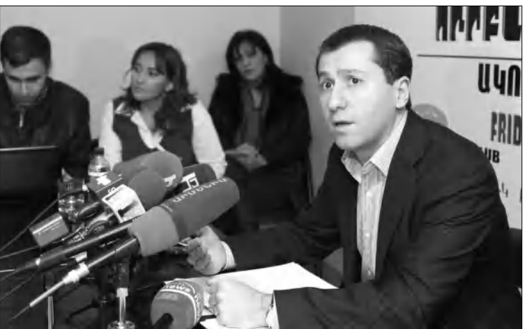
Անդրեասյանի մեկնարկներով էլ լրագրողական կազմակերպությունների կազմված ինֆրակարգավորող մարմինը դեմ է դառնում միջոցը լրասվամիջոցների եւ այն մարդկանց միջոց, որոնց անունն արտասվում է: Նա վստահ է, որ վեճերի ֆադաբակիթը լուծման ձեռք հենց այդ մարմնի գոյությունն է: Ըստ դասարանի՝ մարդը, ում մասին մամուլում հոդված է տպագրվել, եւ նրա անունն ու համարվել արտասվում են, կարող է դիմել ինֆրակարգավորող մարմինը եւ միայն կոմիտեի պատասխաններն ու գործողությունները չբավարարելու դատարանում դիմել դատարան: «Սա է ֆադաբակիթը ճանադարի: Մարդկանց այդքան բերելու երկար աշխատանքի արդյունք է, եւ մեկ օրում դա չի կարող լինել»: Օմբուդսմենը հիշեց, որ տարիներ առաջ Երեւանում հանդիպել է ամերիկացի մասնագետին, որը հայաստանյան լրագրողական դասն ու լրագրում առկա խնդիրները սմանցրել էր 200 տարի առաջվա Ամերիկային, որ նման էր ջուռային:

«Երկու ուղղությամբ կարող են աշխատել: Առաջինը օրենսդրական փոփոխությունն է: Ես դասարան են նախաձեռնել ու առաջարկել նախագծման աշխատանքներ: Բայց քանի որ կա նախադրականում իմ նախկին գործունեությունն էլ մասնակար, առաջարկում են լինել ոչ թե հիմնական առաջարկող, այլ՝ աջակից»: Երկրորդ ուղղությունը վերաբերում է մամուլի ինֆրակարգավորման մարմնի կառուցմանը վրա կենտրոնացված: