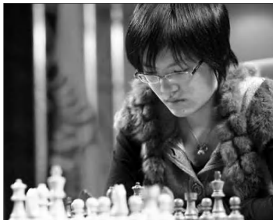
Տիբեթում: Թագակիրներ են դարձել Լյուդմիլա Ռուդենկոն (1950-1953-ին), Ելիզավետա Քիլոկան (1953-1956-ին), Օլգա Ռուբցովան (1956-1958-ին), Նոնա Գափրիդյան (1962-1978-ին) եւ Մայա Չիբուրդանիսեն (1978-1991-ին): 2004-2006-ին աշխարհի չեմպիոնուհի է հռչակվել բուլղարուհի Անտոնետա Ստեֆանովան, իսկ 2008-2010-ին ժամանակի թագուհի դարձավ չինուհի Հոու Յիֆանը:

Չինացի գրոսմայստեր Հոու Յիֆանը 2-րդ անգամ նվաճեց ժամանակի աշխարհի չեմպիոնությունը: Տիրանալով ընթացող աշխարհի չեմպիոնությունը Տիբեթի մրցախաղի 8-րդ դարձի 80-րդ փուլին ավարտվեց ոչ-ոքի: Այսօրվա, հաշիվը դարձավ 5,5-2,5 հոգու աշխարհի գործող չեմպիոնուհու, որն անհասանելի դարձավ Համի Կոնցեյի համար: Ուստի մրցակարգով նախատեսված մնացած երկու դարձիներն այլևս չեն անցկացվի: