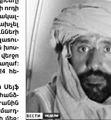
Մորենո Օկամոյոյի այցելության ժամանակ: Լիբիայի սեղեկավարության նախարար Մահմուդ Շամմարը կարծում է, որ Սեյֆ ալ Իսլամին դեմ է դառնել հայրենիքում, ֆանի

Լիբիայի հարավում լույս բարձր գիտերը ձերբակալվել է Մուամար Զադրաֆիի որդի Սեյֆ ալ Իսլամ Զադրաֆին: Նա ձերբակալվել է այն դեպքում, երբ փորձում էր փախչել հարեան Նիզեդ: Որոշ սեղեկությունների համաձայն, Սեյֆ ալ Իսլամը իր ազատության դիմաց ԱՄՆ զինվորականներին խոստացել է 2 մլրդ դոլար կաշառք, բայց ի վերջո նրան օդանավով սարել են Չինաստան: Այդ մասին հաղորդում է «Ռոսիա 24» հեռուստաալիքը: Նոր իշխանություններն ուզում են Սեյֆ ալ Իսլամին դառնել Լիբիայում ել չհանձնել Միջազգային ֆրեական դատարանին (ՄԶԳ), որը նրան ամբաստանում է մարդկության դեմ ուղղված հանցանքների մեջ: «Մայ նյուզ» հեռուստաալիքը նշում է, որ ԱՄՆ որոշումը, սակայն վերջնական ել դատարանական չէ: Սեյֆ ալ Իսլամի հետագա ձևակազմի ֆնարկման թեմա կդառնա ՄԶԳ գլխավոր դատախազ Լուիս