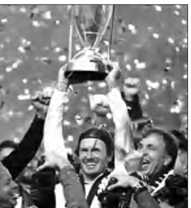
որի հեղինակը Դոնովանն էր: հավաքվեցին գոլային լավ դաշտ ունեցավ Բեհեմը, սակայն դրությունը փրկեց դարձառաջնորդը: Նախկինում «Լու Անջելես Գելֆանդ» ԱՄՆ-ի առաջնության հաղթող էր ձանաչվել 2002 և 2005-ին: Էդր դասակարգված ԱՄՆ ՀԱՅՐԱՊԵՏՅԱՆԸ

«Լու Անջելես Գելֆանդ», որում հանդես են գալիս համաշխարհային ֆուտբոլի «ասուղեր» Դեյվիդ Բեհեմը, Ռոբի Զինը և Լեոնոն Դոնովանը, 3-րդ անգամ ուժեղագույնը ձանաչվեց ֆուտբոլի ԱՄՆ-ի առաջնությունում: Եզրափակիչ խաղում «Լու Անջելես Գելֆանդ» 1-0 հաշվով հաղթեց Յուտանի «Դինամոյին»: