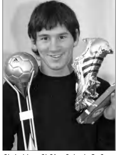
ների կիսանմուշ», նշել է Ռոնալդոն: Իսրայելիայի լավագույն մարզիկն է արժանացել Մարիո դի «Ռեալի» գլխավոր մարզիչ ժոզե Մուրիյոյուն: Նա նշել է, որ հոլանդացի Միլոս Մուրիյոսի անվան մրցանակին արժանանալու համար:

Լիոնել Մեսին անցած մրցաշրջանի արդյունքներով ճանաչվել է նաև Իսրայելիայի լավագույն ֆուտբոլիստ: Նրան հանձնվել է Ալֆրեդո դի Ստեֆանոյի անվան մրցանակը: Հիշեցնենք, որ Մեսին մինչ այդ արժանացել էր նաև աշխարհի եւ Եվրոպայի լավագույն ֆուտբոլիստի տիտղոսներին: Լավագույն ռմբարկուի համար սահմանված մրցանակը հանձնվել է Մարիո դի «Ռեալի» կիսադասարան Զիլեբրինս Իսրայելիայի առաջնություններում արդյունավետության մեծ ռեկորդի հեղինակ դարձավ խփելով 41 գոլ: «Տեսնենք, թե ինչ տեղի կունենա առաջիկա տարիներին: Դժվար է գուշակել, թե կգերազանցվի՞ իմ ռեկորդը: Եթե որևէ մեկին դա հաջողվի, ուրեմն նա արժանի կլինի դրան: Բացի գոլ խփելուց, ես նաև օգնում եմ թիմակիցներին դարձնելու գրավելու: Եթե մենք բարունակենք մույն ոգով, ապա նշանակալի հաջողություններ կունենանք»: