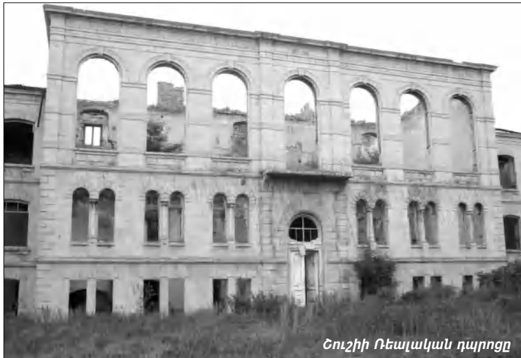
Շուշիի Ռեալական դպրոցը

Բակուր Կարապետյանը Շուշիի անցյալի և ներկայի մասին դասընդ յոթ հազար լուսանկար է հավաքել: Այդ լուսանկարները շատ բան են խոսում Շուշիի դաժնորությունից: Դրանցից 1900-ը սեղանադրված են էլեկտրոնային թանգարանում՝ Avetis.org եւ ուրիշ շատ հասցեներում: Բ. Կարապետյանն ասում է, որ ոչ մի կերպ չկարողացավ հասնել նրան, որ Շուշիում մի փոքրիկ սարածի հասկացնեն, ինքն այդ լուսանկարներից մեծաթե գործող էֆուդիցիա ցուցադրի: Իսկ բուն Շուշիում անբարեհաճություն նկատեցին Բակուրի այդ ցանկության հանդեպ, թե՛ թող նվիրի թանգարանին, ծրի ցուցադրի եւ այլն: Այսինքն Շուշիում բոլոր սովորել են անվճար նվերների, մինչդեռ մարդը երկար սարիներ իր ժամանակը նվիրել է լուսանկարների հավաքմանը: Սա՛ իմիջիայլոց: Սակայն Շուշիի անցյալն ու ներկան ամեն Շուշի մտնող է փնտրում եւ երբեմն դա նրան հաջողվում է, որովհետեւ մի շարք կառույցներ, բնակատեղիներ ու վկայություններ, այնուամենայնիվ, հիշեցնում են Շուշիի փառավոր անցյալի եւ ներկա դժվարությունների մասին: Այժմ Արցախում եւ Շուշիում ղեկավարվող կառույցները կենսորոնացել են Շուշիի զբոսայգի