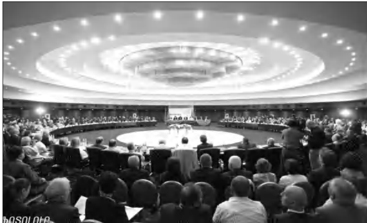
բարեբեմ, սեսնել հայոթյունն ալելի համախանբված, ալելի կուռ ու կազմակերմված: Մեզ միավորում են ոչ միայն մեր արմասները,

հայոթյան խաղաղ ու բարեկեցիկ աղազայի: «Այս դահլիճը հավախական ուժ է ներկայացնում: Այն 10 միլիոն հայերի գորոթյան խորհուրդն ունի եւ հղարսոթյուն է առաջացնում: Այդ ուժը համահայկական բազում խնդիրներ է լուծում սասանյակների ընթացում եւ կԵարունակի լուծել: Հայ ժողովրդին միավորում են մեր ազգային իղծերն ու Հայասանի ճակասազիրը: Մեր բոլոր մեթերը, աղուաները, երթեմն զայրոթյան ու դորթկուանը, թեժ բանակեծերն ու հանդարս ֆնանսումները, լուռ ախասանն ու բողոթի դրսետումը ընդհանուր առմանք ունեն մեկ նդասակ՝ սեսնել վաղվա Հայասանն ավելի լավ, ավելի հզոր, ավելի գեղեցիկ, ավելի