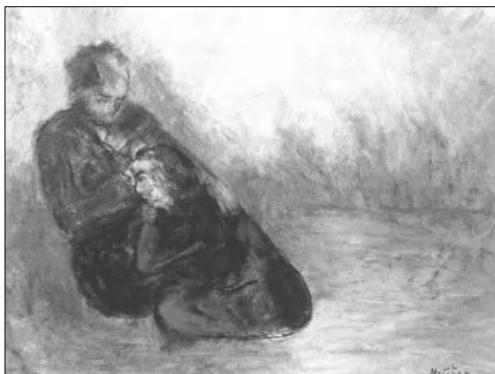
Չարեհ Մուսաֆյան. Եղեղից փրկվածներ. 1965թ.

Մեր հարցին, թե ինչո՞ւ ինչպե՞ս հեղինակների գործեր են բերվել Հայաստան, արվեստագետը դասասխանեց.