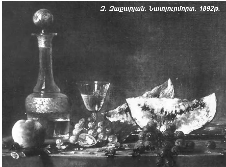
2. Չաքարյան. Նատյուրմորտ. 1892թ.

Չաքարյանի հրաշալի մի գործ, որ 1890-ականների միջազգային ցուցահանդեսում արժանացել էր ոսկե մեդալի: Այս անգամ սիրելի Լորիսն ուղղակի ցնցեց ինձ՝ Մայր աթոռի թանգարանին նվիրաբերելով Չ. Չաքարյանի այդ հիասանյակը ստեղծագործությունը: