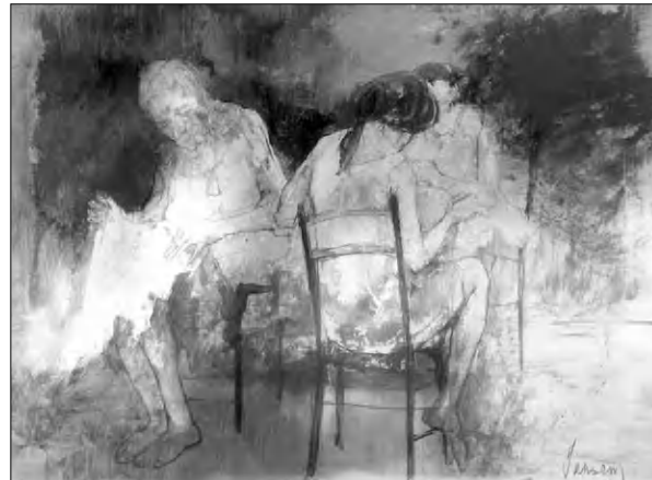
Չանսեմ. Ասեղնագործ կանայք. 1968թ.

- Նախ ասեմ, որ անցած տարիներին մի քանի այցելում էի փարիզյան համալսարանի անգլերենի դասախոս Լորիս Մոսիճյանին: Նրա մոտ գտնվում էր իր հորից ժառանգված, նախորդների անվանի վարդես