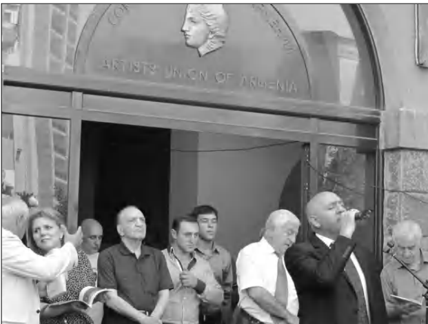
Ցուցահանդեսի բացման տեսարանից

Երեկ ՀՀ նկարիչների միությունում «Հայկական ներկադրանակ» փառաճոնի ցուցահանդեսում տեղի ունեցավ «Շիրակի ամառային գույները» ցուցահանդեսի բացումը: Ավերված Հայաստանի անկախության 20 ամյակին: Կազմակերպիչներն էին ՀՀ նկարիչների միությունը, Գյումրու ֆաղափառաճոնը, «Լուսին» հայրենակցական միությունը, «Փյունիկ» հիմնադրամը: