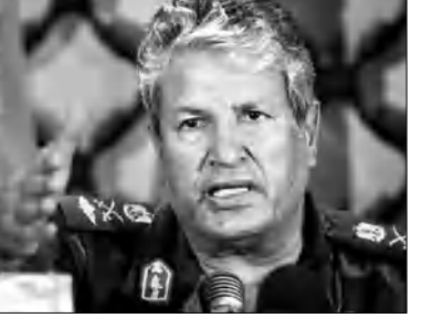
մային ազգային խորհրդի անվանագրության ծառայությունը: Գրամանատարին եւ նրա օգնականներին դեմ է հարցախնդիրը կապակցվելով, թե Յուսուֆը ընտանիքը

Լիբիայի Անգուստինո ազգային խորհրդի ղեկավար Մուսաֆա Աբդու Չալիլը երեկ հայտարարել է, որ հուլիսի 28-ին հարձակման ենթակառնվող սղանվել է ընդդիմության զինված ուժերի հրամանատար Աբդու Ֆաթթահ Յուսուֆը: