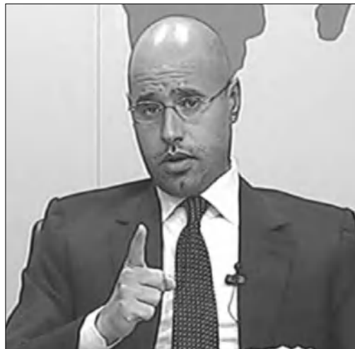
կանարս կողմերին կոչ է արել անմիջական բանակցություն սկսել

Սարկոզին բանակցելու ելակն լիբիական վարչակազմի ներկայացուցչին իբր ուղղակի ասել է. «Մենք ստեղծեցինք խորհուրդ, եւ նա չէր կարող գոյատևել առանց մեր աջակցության, առանց մեր փողի ու զենքի»: Պատրիարքն ասել է, որ Ֆրանսիան առայժմ որեւէ ձեռնարկ չի մեկնաբանել Մեյֆ ալ Իսլամի Զադրաֆիի այդ հայտարարությունները: Միաժամանակ հաղորդվում է, որ Ֆրանսիան խոստովանել է Լիբիայում ՆԱՏՕ-ի սանձազերծած ղեկավարման անհեռանկարայնությունը: Արտգործնախարար Ժերար Լոնգան հա-