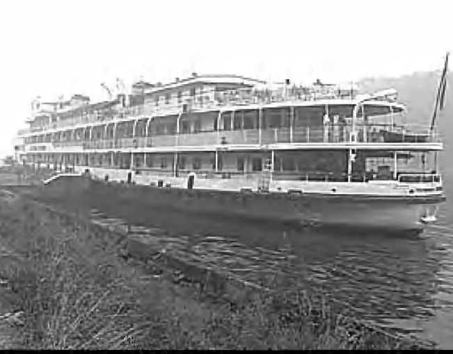
Հուլիսի 10-ին Կոյբեքեի ջրամբարում (Վոլգայի վրա) խորհրդակցություն կատարեցին Վրացի Պատրիարքի ավան մեկնած «Բուլգարիա» ջերմանավոր: Ռուսական լրատվամիջոցների վերջին տեղեկությունների համաձայն, նավը Կազանից դուրս էր եկել անսարք ձախ Երուսաղեմ: Այդ մասին հաղորդվում է սրանադորի մեծամասնական կոմիտեի

Չնայած երկրորդ հարաբերություններում ծագած լարվածությանը, ԱՄՆ-ը մտադիր չէ հրաժարվել Պակիստանից՝ իսլամական ծայրահեղականության դեմ մղվող լարվածությանը իր գլխավոր դաշնակցից: Մասնավորապես, Պենտագոնի ղեկավար Լեոն Պենտասան հուլիսի 8-ին հայտարարեց, որ Վաշինգտոնը կարողանալի «հասուն ուշադրություն դարձնել Պակիստանին»: