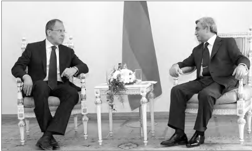
Սերգեյ Լավրովը և Բաբու Սարավը ընդհանուր խոսակցության ընթացքում:

Ա. ՏՐԱՆՍՊԱՐԵՆՑԻԱՅԻ Ռուսաստանի նախագահ Դմիտրի Մեղվեղեյը, չնայած, սարբեր տեղեկություններով, հետևազանյան հիասթափությանը, փաստացի առավել ակտիվ ու ջանադարձ է որոշել զբաղվել դարաբարդյան հակամարտության կարգավորման հիմնարար սկզբունքները կամ դրանց վերաբերող փաստաթուղթ ստորագրած տեսնելու հարցով: Այդ է վկայում արագընթաց այցով սարածաբանում հանդիպումներ ունեցած ՌԴ ԱԳ նախարար Սերգեյ Լավրովի գործունեությունը, երբ ինչպես Յայասանի, այնպես էլ Ադրբեջանի նախագահներին նա, իր իսկ խոստերով, փոխանցել է Մեղվեղեի առաջարկները: