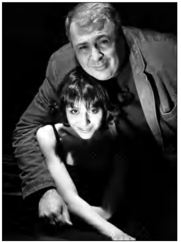
Դերասանուհին եւ ռեժիսորը

ՌՈՒՉԱՆՆԱ ԱՍՏՆԱՍՄԱՐՏԻ ԵՆԹՎՊԻ ԹԱՏԵՐԱԳԻՏՈՒՅԱՆ Ֆալկ, 3-րդ կուրս