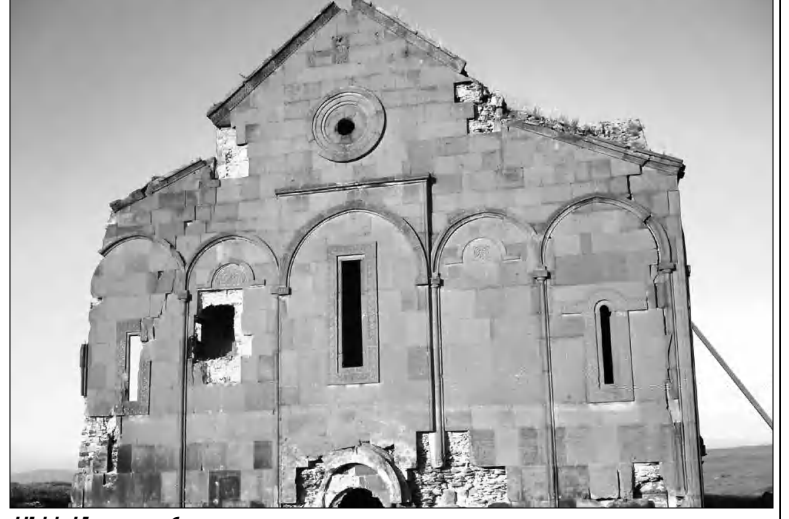
Անիի Սայր տաճար

Անիի արաքին դարձից դուրս է գտնվում Չովի եկեղեցին: Գոթական ոճով կառուցված եռահարկ եկեղեցին ճարտարապետա-