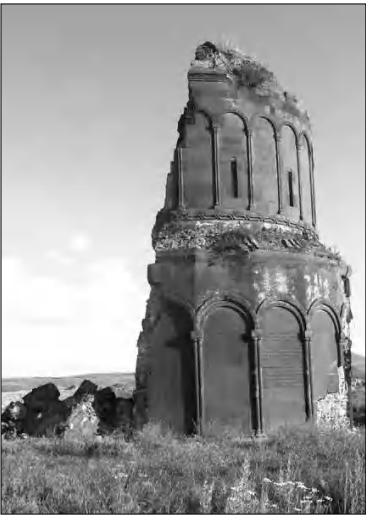
Սուրբ Ամենափրկիչ եկեղեցի

Կարսից դեղի Անի հասնելու համար անհրաժեշտ է անցնել 45 կիլոմետր ճանապարհ: Չափազանց դժվար ու ծանր է այդ կիլոմետրերը հաղթահարելը: